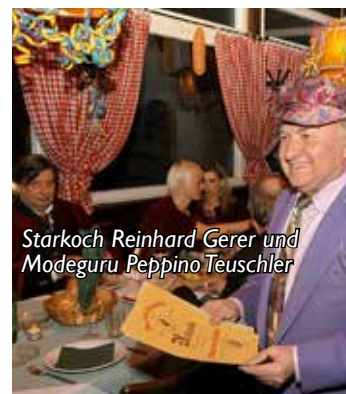
Starkoch Reinhard Gerer und Modeguru Peppino Teuschler