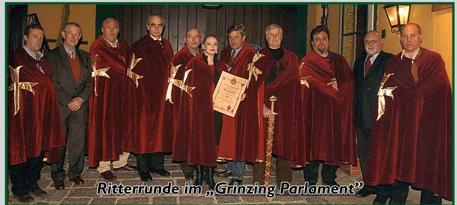
Ritterrunde im „Grinzing Parlament“