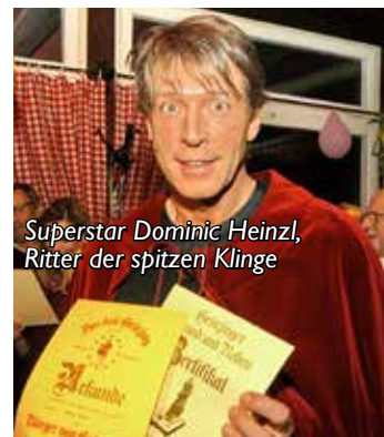
Superstar Dominic Heinzl, Ritter der spitzen Klinge