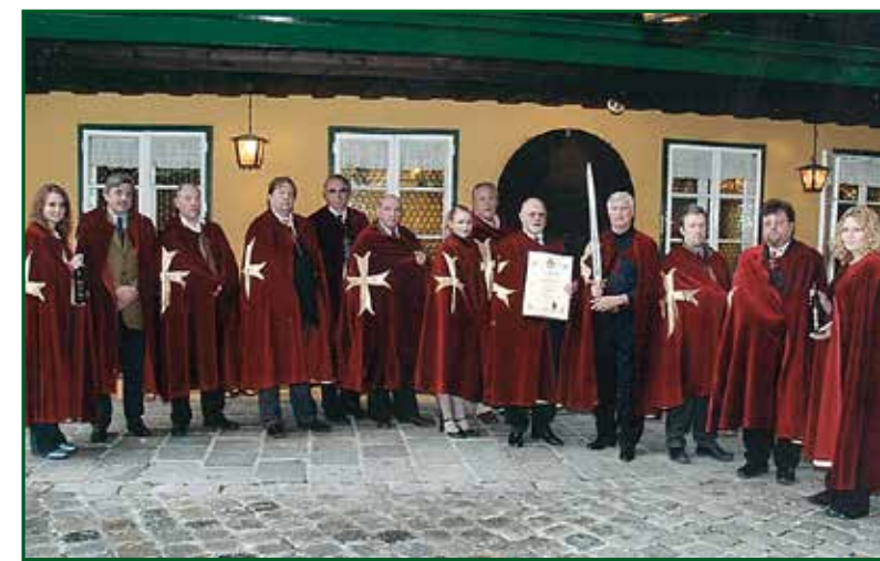
Ritterrunde und Ritterschlag beim Alten Bach-Hengl