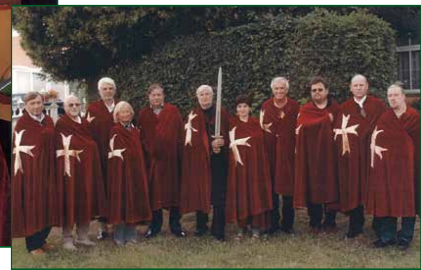
Ritterrunde am Cobenzl